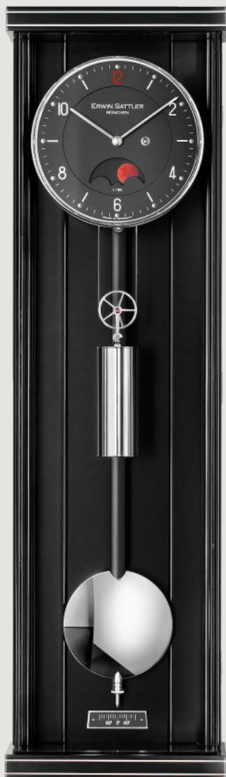
Schwarzer Schleiflack mit Metallintarsien