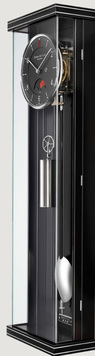
Black varnish with metal inlays